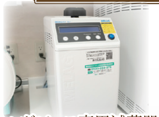
ハンドピース専用滅菌器