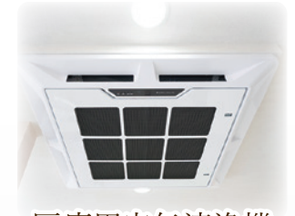
医療用空気清浄機