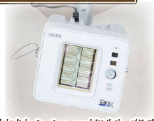
非接触ウイルス抑制・殺菌灯