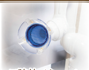
口腔外バキューム